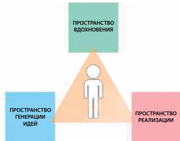
Работа дизайн-менеджера в трех пространствах

с техникой мозгового штурма участники прорабатывают множество идей. Действует негласный запрет на осуждение идеи коллеги. Однако те идеи, которые по большинству голосов лидируют, становятся приоритетными. Каждый член команды дизайн-мыслителей должен ставить интересы всей группы выше своих собственных.