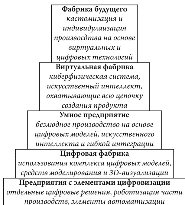
Рисунок 1 – Пирамида понятий предприятий Индустрии 4.0

В основе пирамиды авторами указано предприятие с элементами цифровизации как подготовительный этап, который проходит предприятие, поставившее перед собой цель создания «умного» производства или фабрики будущего. Как правило, лишь создавая производство с нуля, возможно сразу начать с этапа цифровой фабрики или «умного» предприятия, изменения же существующих производств происходят постепенно путем внедрения новых технологий, методов управления и цифровых систем.